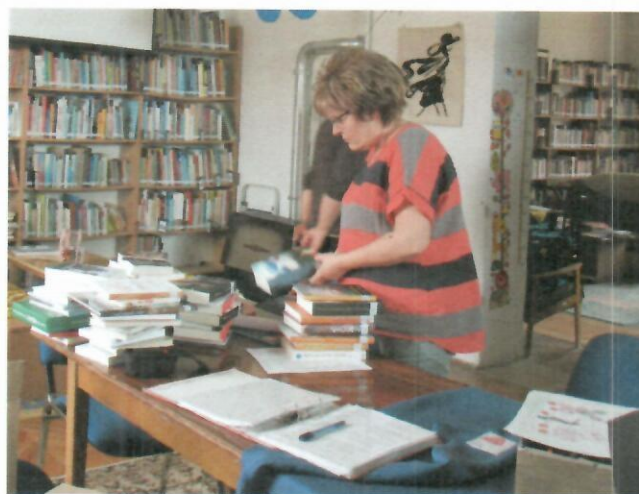
Új könyvek, irodaszerek, egyéb eszközök kiszállítása