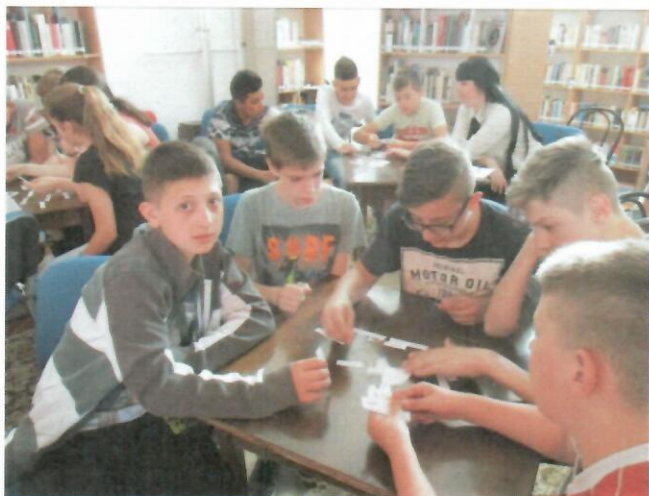
KönyvtárMozi – Cigánymesék foglalkozás